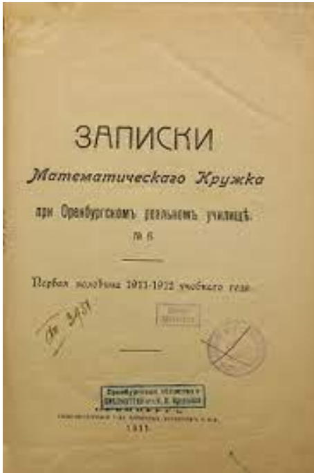
Рис. 3. «Записки математического кружка» № 6 за 1911 г.

Пятым изданием стали вышедшие в том же Оренбурге в 1908 г. – «Записки математического кружка при Оренбургском реальном училище» (Рисунок 3). Журнал издавался в период с 1908 по 1914 гг. и всего вышло 10 номеров данного издания. Редакция журнала предпринимала попытку объединения преподавателей и учащихся на ниве совместной учебно-научной работы как в кружке, так и на страницах издания. Наряду со статьями математического характера публиковались и общие педагогические статьи (например, по вопросам ученических экскурсий и др.) (Аблов, 1937: 76).