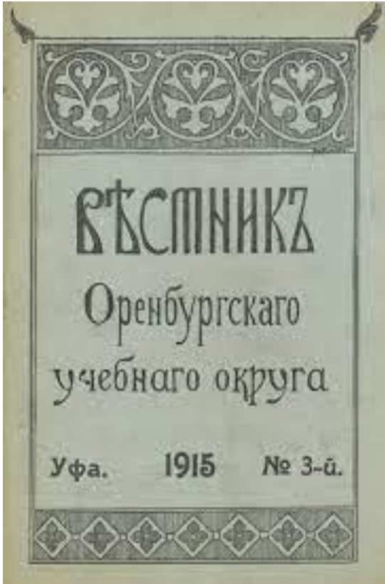
Рис. 5. «Вестник Оренбургского учебного округа» № 3 за 1915 г.

В 1912 г. в Уфе возникает седьмое педагогическое издание – «Вестник Оренбургского учебного округа» (Рисунок 5). Его редактором был окружной инспектор М.А. Миропиев. Ежегодно издавалось по 8 номеров данного издания в период с 1912 по 1915 гг. (Беляева, 1958: 212)