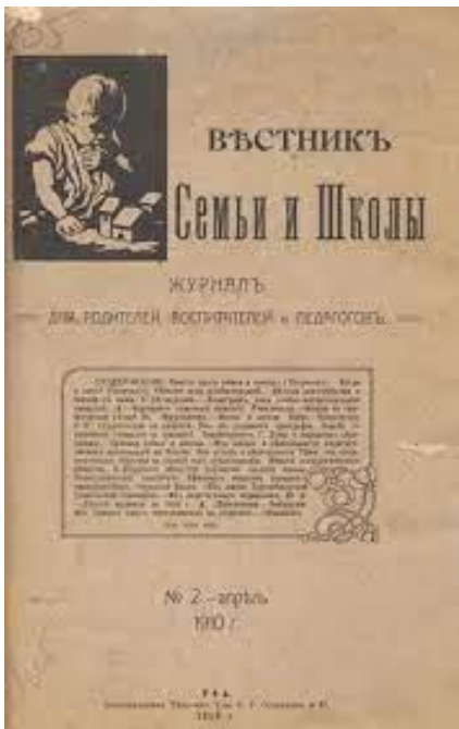
Рис. 4. «Вестник семьи и школы» № 2 за 1910 г.