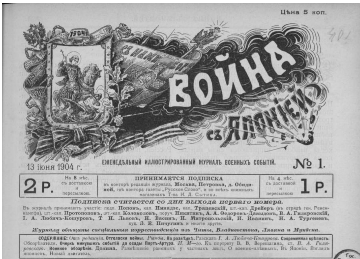
Рис. 2. Титульная страница журнала «Война с Японией»

Понятен поэтому и общий, всезахватывающий интерес к военным событиям, перед которым отходят на задний план наши обычные интересы. Чем сильнее и жизнеспособнее народ и государство, тем интенсивнее напрягаются его силы в дни грозного военного испытания, тем более является примеров самоотвержения и героизма, – примеров, которых уже не мало дала настоящая русско-японская война. Этот важный исторический момент, переживаемый в настоящее время Россией, подвинул нас к изданию специального журнала, цель которого правдиво излагать и освещать все события войны, оставляя в стороне все ложные слухи, и, не преследуя минутного интереса, дать ей разностороннюю и живую историю» (От редакции, 1904: 2). Объем журнала насчитывал 16–24 страницы, а в единственном сдвоенном номере – 32 страницы. Четкой рубрикации журнал не имел. Большая часть его материалов носила публицистический характер, однако печатались в нем и заметки очевидцев данных событий (то есть материалы личного происхождения). Уделялось внимание также специальным работам, посвященным военному делу и военному искусству. Всего вышло 35 номеров данного журнала, причем последний был сдвоенным (№ 34 и 35). 9 декабря 1904 г. в журнале было опубликовано объявление, что он перестанет издаваться с 1 января 1905 г., поэтому редакция приняла решение в последний месяц издавать журнала два раза в неделю. Последний его номер был опубликован 31 декабря 1904 г.