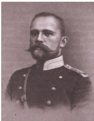
Рис. 1. Иван Иванович Митропольский (1872–1917 гг.)

По мере того как стало очевидным, что война затягивается, 13 июня 1904 г. в Москве был открыт еженедельный иллюстрированный журнал военных событий под названием «Война с Японией». Нужно сказать, что это было одной из первых попыток в России создать журнал, посвященный только боевым действиям периода русско-японской войны. Его редактором-издателем стал известный литератор, офицер 3-го гренадерского Перновского полка И.И. Митропольский (Рисунок 1). Журнал печатался в типографии И.Д. Сытина (Рисунок 2).