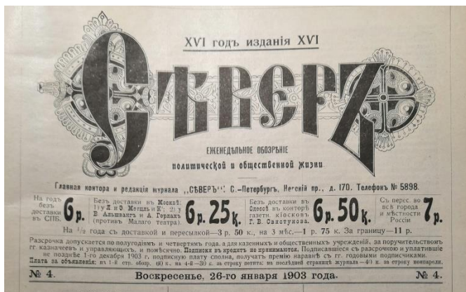
Рис. 1. Начало титульной страницы еженедельного обозрения политической и общественной жизни «Север», 1903