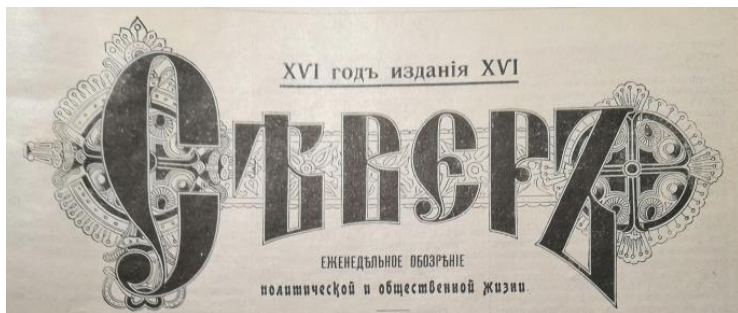
Рис. 3. Заголовок еженедельного обозрения политической и общественной жизни «Север»

Стоит особо обратить внимание на оформлении заголовка в обозрении политической и общественной жизни. Как и на странице литературно-художественного журнала, заголовок выделяется размером и жирным шрифтом. Однако если в журнале заголовок украшен декоративными элементами растительного характера, то в обозрении заголовок представлен на декоративно-орнаментальном фоне, напоминающем государственные знаки отличия: ордена, медали (Рисунки 3, 4).