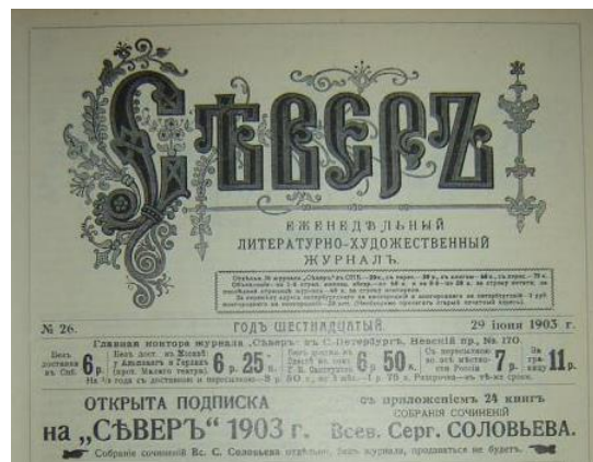
Рис. 2. Начало титульной страницы литературно-художественного журнала «Север», 1903

Данное приложение являлось неотъемлемым структурным элементом литературно-художественного журнала «Север». Выходило оно также один раз в неделю, как и журнал, что свидетельствует о значимости данного приложения для российского общества, о стремлении редакции донести до читателя самые актуальные вопросы не только в сфере литературы и художественной жизни России, но и общественной и политической жизни. Структура расположения постоянных элементов изданий на титульной странице совпадает у обозрения и литературно-художественного журнала: заголовок, вид издания, адрес редакции, стоимость подписки.