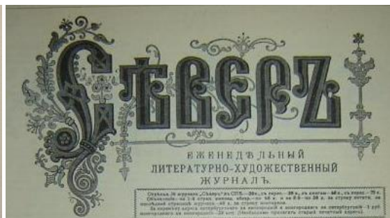
Рис. 4. Заголовок еженедельного литературно-художественного журнала «Север»

Подобное визуальное оформление заголовка обозрения придает изданию официальный характер, подчеркивает его общественно-политическую значимость.