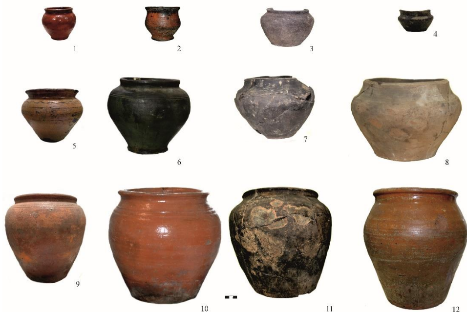
Рис. 1. Русская керамика Прииртышья XVII–XX вв. Горшки. 1, 2, 3, 4 – маленькие горшки первой группы; 5, 6, 7, 8 – горшки среднего размера – вторая группа; 9, 10, 11, 12 – горшки и корчаги – третья группа. 1, 5, 9 – коллекция этнографической керамики Большереченского историко-краеведческого музея «Старина Сибирская», XIX–XX вв.; 2, 6, 10 – коллекция этнографической керамики Тобольского историко-архитектурного музея заповедника XIX–XX вв.; 3, 7, 11 – коллекция из раскопок поселения Ананьино-I, XVII–XVIII вв.; 4, 8, 12 – коллекция из археологической коллекции г. Тары, XVII–XVIII вв.

На этом основании выделены три группы горшков: малые, средние и большие (Таблица 1).