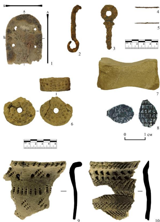
Рис. 2. Находки на поселении Энеково

1, 4-5, 8-10 – находки 2019 г.; 2-3, 6-7 – находки 2002 г.