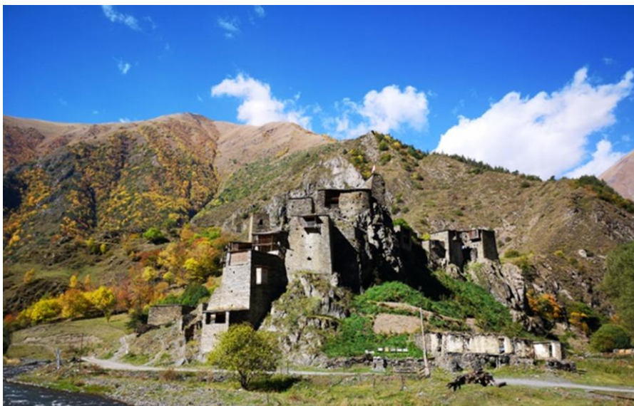
Рис. 8. Вид крепости со стороны Чечни

В то же время укрепления на чеченском фронте остались невредимыми (Рис. 8).