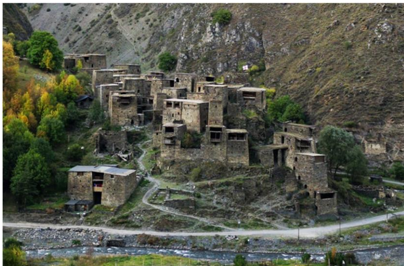
Рис. 1. Деревня-крепость Шатили

Заняв Шатили, 4-го июня генерал-майор Симонович отправил отряд под командованием полковника Тихановского в кистинские деревни. Мятежники из кистинов и здесь были разбиты русским отрядом. 9 селений кистинов были преданы огню (АКАК, 5: 536). 5-го июня отряд благополучно вернулся в Шатили. 6-го июня Симонович повел войска в обратный путь и 7-го июня прибыл в селение Лебайс-кари. С 9-го до 12-го июня войска участвовали в боевых действиях, стремясь наказать хевсуров за участие в мятеже путем сжигания их деревень. В эти дни были преданы огню 20 деревень (АКАК, 5: 536). Практически все из них были взяты штурмом, а именно: Хахматисджвари, Чормети, Гудани, Ликоки, Акушо, Бацалиго, Циклидо, Атабети, Худа, Хорнаули, Рошкиони, Кмости, Гелегули, Барис-ахо, Укан-ахо, Чрдили, Гвелети, Датвиси и Моцма. И здесь войска несли потери, среди раненых был майор, князь Орбелиани (АКАК, 5: 536).