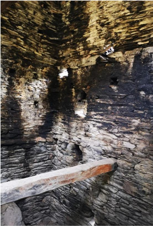
Рис. 2. Следы пожара в башне

Также это наглядно демонстрирует и современное состояние крепости. Сделанные нами изыскания на местности в сентябре 2018 г. в Шатили показывают следующее: