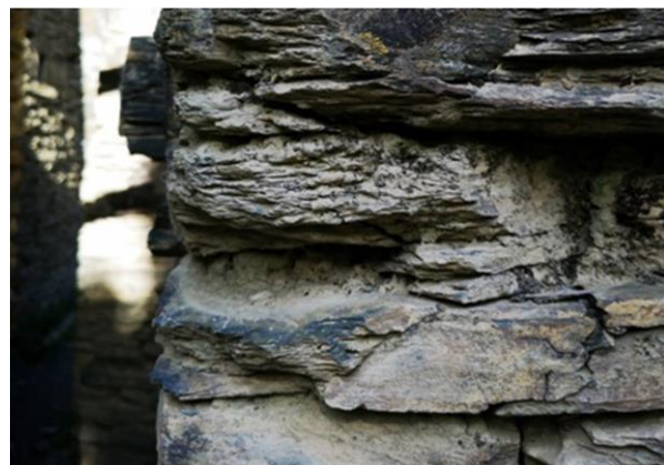
Рис. 7. Кладка других башен крепости