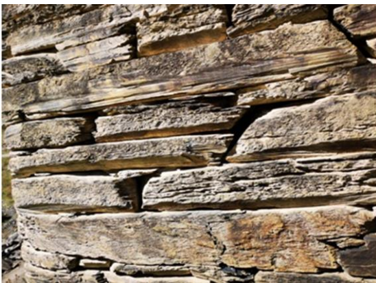
Рис. 6. Кладка сохранившейся башни

На Рис. 5 в квадратах красного цвета представлены руины башен на грузинском фронте. Нарушает логику полностью сохранившаяся двойная башня в квадрате зеленого цвета. Детальное изучение сохранившейся башни показало, что она была построена без связующего раствора ( Рис. 6 ), в то время как в кладке других башен связующий раствор имеется ( Рис. 7 ). Таким образом, это доказывает, что сохранившаяся башня была построена позднее.