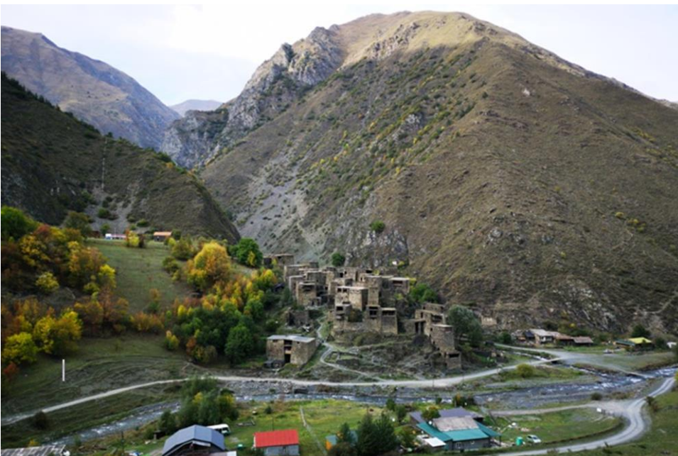
Рис. 3. Вид на Шатили с соседней горы

Также это наглядно демонстрирует и современное состояние крепости. Сделанные нами изыскания на местности в сентябре 2018 г. в Шатили показывают следующее: