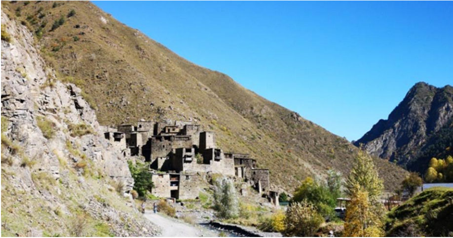
Рис. 4. Вид на крепость при движении со стороны Грузии

Более детальное изучение крепости показывает, что со стороны грузинского фронта имеются масштабные разрушения крепости.