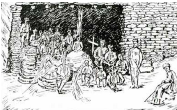
Рис. 1. Хати в Шатили (Хевсурети) (Cherkasov et al., 2018: 62)

Молельни считались святыми местами, поэтому они обносились каменной оградой и обсаживались деревьями. Женщинам доступ в хати был запрещен. Молельня заключала в себя несколько культовых сооружений, среди них главное – ниши или башня, представляемая самый распространенный у грузинских горцев вид молельни (Макалатия, 1940: 200). «Ниши» представляли собой каменный столб четырехугольной формы; высота его достигала двух метров. Ниши строились из плитняка, без извести; спереди они обычно имели небольшое квадратное углубление с полкой для приношений и свечей. Верхушка ниши разукрашена турьими и оленьими рогами, пожертвованными охотниками.