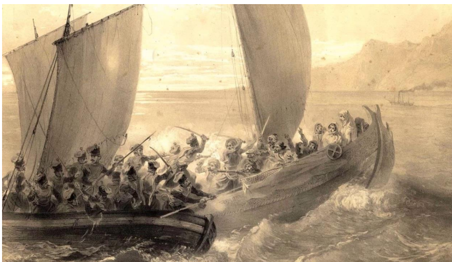
Рис. 3. Азовские казаки атакуют турецких пиратов. Картина Григория Гагарина 1847 года (Karataev et al., 2016: 394)

К 1855 г. часть Рионской флотилии находилась в плохом состоянии. Дело в том, что срок службы баркаса составлял 6 лет. В результате 6 баркасов нуждались в замене, хотя некоторые могли еще использоваться. Тем не менее во время войны на 1856 г. были выделены средства и люди для строительства новых азовских баркасов для Рионской флотилии (АКАК, 11: 938).