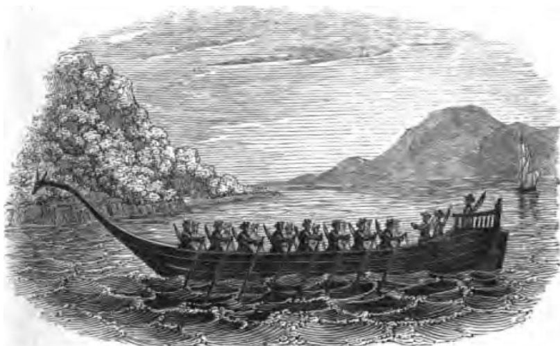
Рис. 1. Черкесская боевая галера ( Marigny, 1837: 2 )

Важно отметить, что в этом вопросе Россия не стала изобретать ничего нового, она лишь переняла черкесский опыт. Благодаря контактам русских и черкесской знати было известно, что с давних пор прибрежные черкесы занимались грабежом торговых кораблей. При этом применялись только гребные суда. Кроме того, с самого начала XIX века фиксировались случаи нападения черкесских гребных судов ( Рис. 1 ) на русский транспорт на реке Кубань. Так, 1 марта 1802 г. черкесы на 20 лодках напали на русский транспорт с порохом и свинцом, который следовал из Бугаза в Екатеринодар. Транспорт охраняли 30 казаков. В ходе нападения судно было захвачено, а 7 казаков погибли ( ГАКК. Ф. 250. Оп. 2. Д. 24. Л. 107 ). В результате этот опыт и решено было использовать.