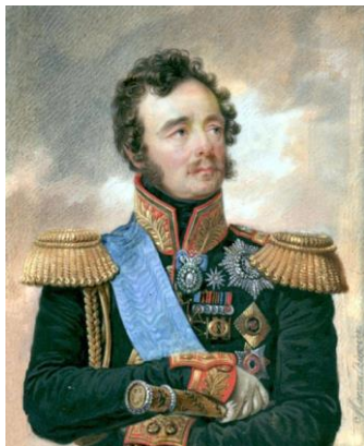
Рис. 1. Генерал Паскевич

Соотношение сторон накануне конфликта было следующим: 8 тыс. человек в составе русской армии и 35 тыс. – в Персидской. Командование русскими войсками осуществлял генерал Паскевич, а персидскими – наследный принц Персии Аббас-Мирза.