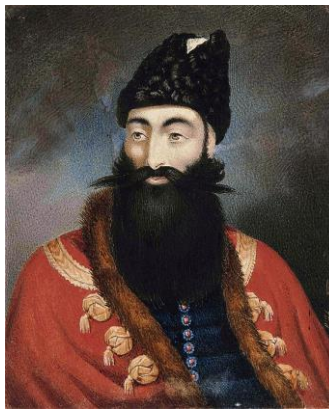
Рис. 2. Аббас-Мирза