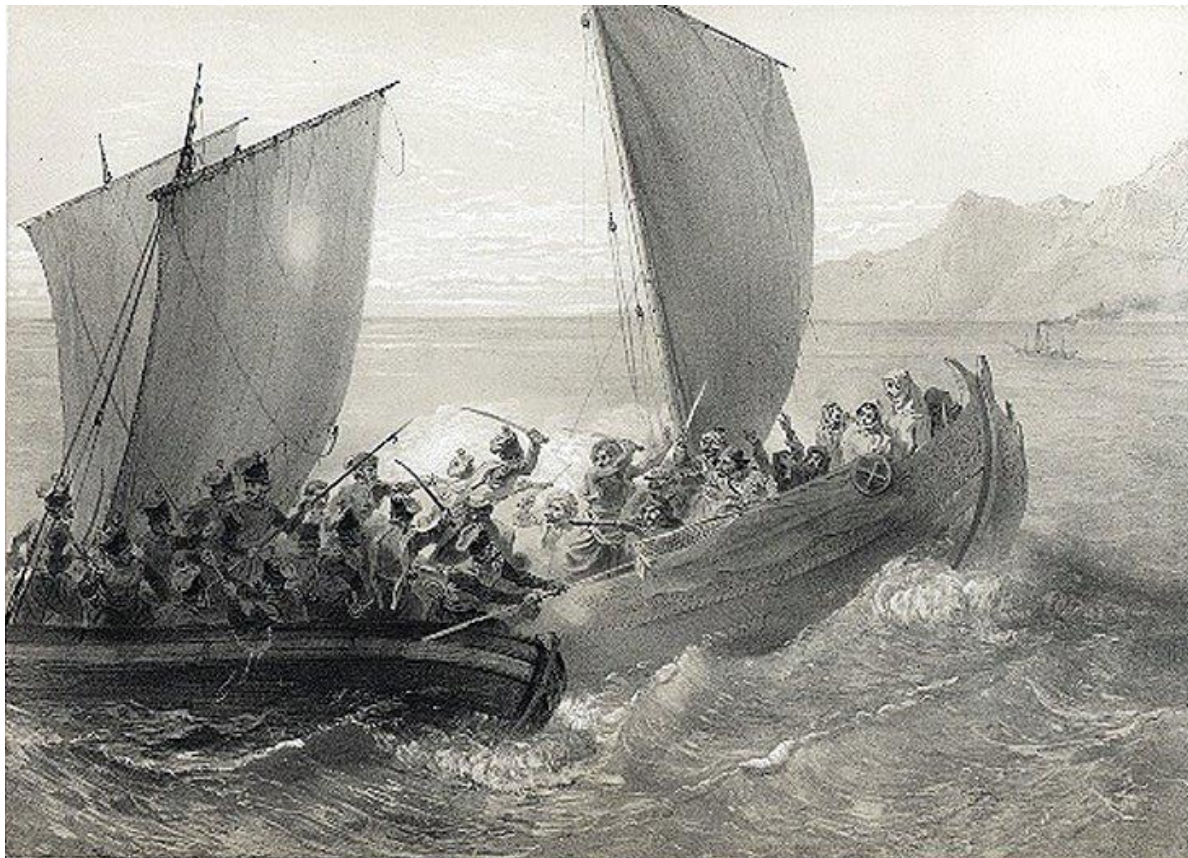
Рис. 2. Азовские казаки атакуют турецких пиратов. Картина Григория Гагарина 1847 года

Наряды по очередям производило само войско, точнее, его наказной атаман Гладкий. Постепенно число баркасов казаков росло. Это было следствием активных действий русских властей в покорении Черноморского побережья Кавказа. Баркасы были необходимы для пресечения черкесской контрабанды, осуществления связи между укреплениями Черноморской береговой линии – сети русских укреплений от Тамани до границ Мингрелии.