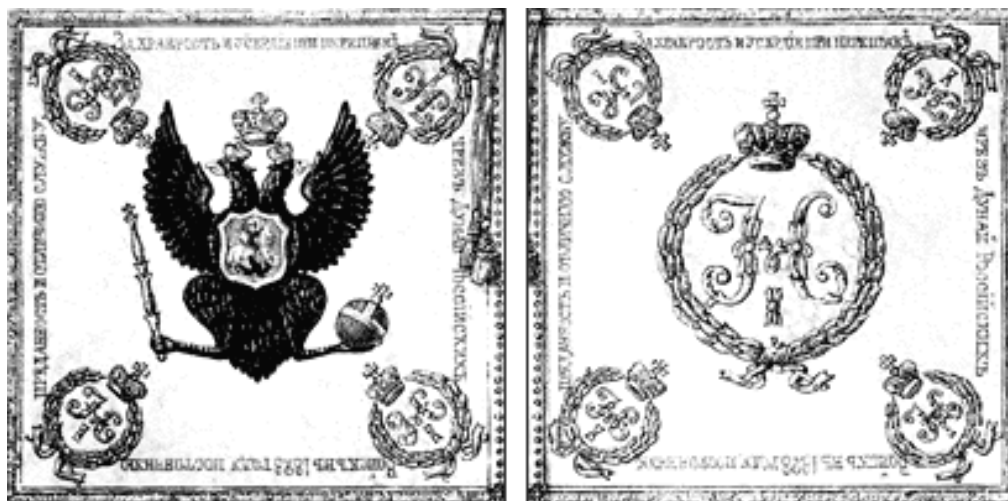
Рис. 3. Регалия Азовского казачьего войска.

На протяжении всего периода существования Азовского казачьего формирования численность его была незначительной. К началу переселения азовцев на Кубань по войску числилось 36 офицеров и 1569 человек строевых нижних чинов. Среди офицеров — 1 генерал и 5 обер-офицеров, которые занимались внутренним управлением войска. Из 1569 человек строевых нижних чинов урядников было 100 и рядовых казаков 1469 человек. На внешней и внутренней службе находилось: в азовских командах при Сухумской и Константиновской морских станциях 34 урядника и 481 казак; в учебной команде 2 урядника и 36 казаков; на должностях по войску 22 урядника и 20 казаков. В отпусках на территории войска находилось 42 урядника и 929 казаков (ГАКК, Ф. 252, Оп. 2, Д. 102, Л. 27-28).