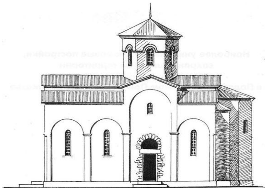
Рис. 1. Вид храма в Лоо XI в.