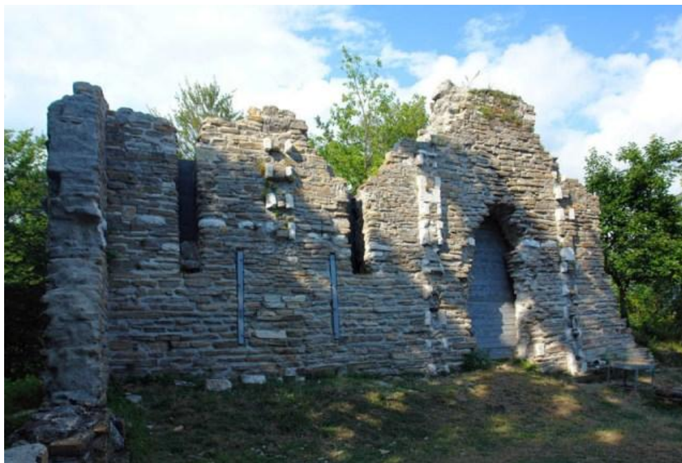
Рис. 2. Руины храма в Лоо. Современное состояние

Обзор имеющихся материалов показывает, что христианство на рассматриваемой территории прочно привилось лишь в приморской зоне. Исследователи обратили внимание на тот факт, что храмы, расположенные вблизи побережья, не имели оград, а храмы, расположенные в горной местности, были защищены мощными стенами. Отсутствие следов христианских храмов в глубоких горных долинах (например, на Красной Поляне) позволяет сделать вывод о том, что здесь христианство не получило широкого распространения.