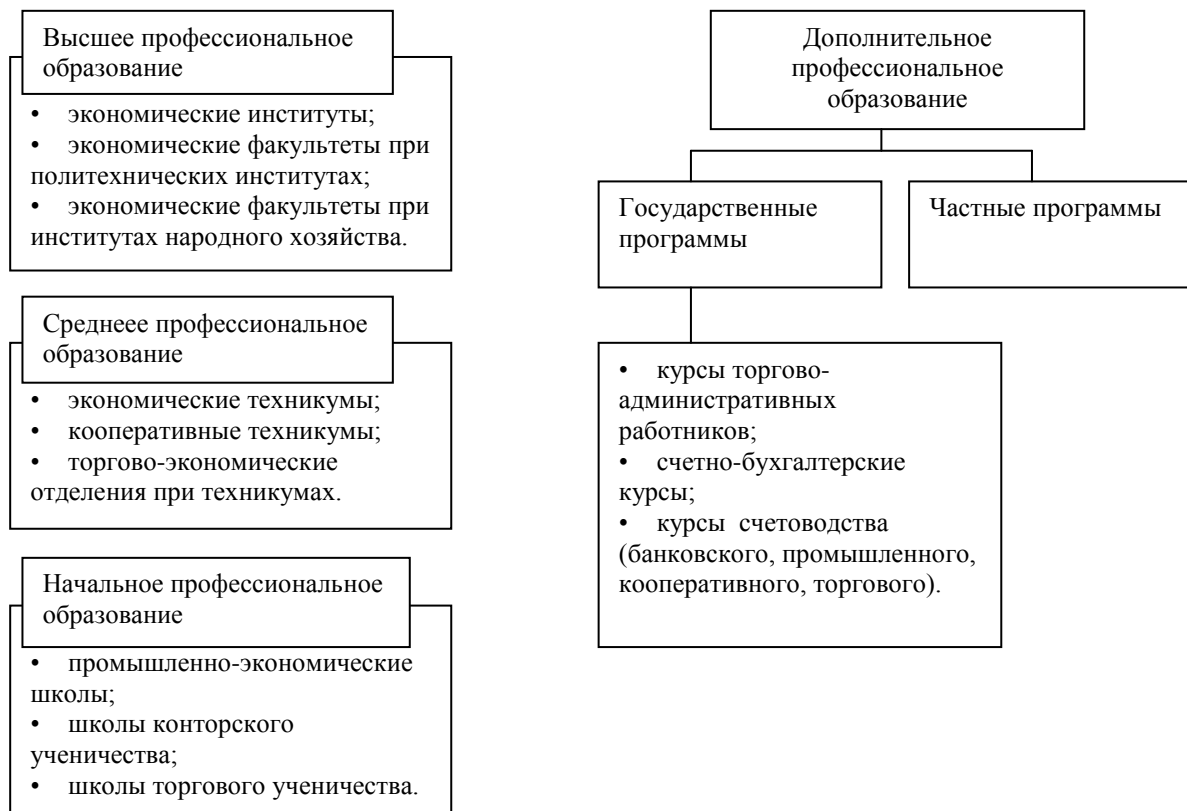
Рис. 1. Модель системы профессионального торгово-экономического образования на начало 1920-х гг. [Составлено по: 6]

Формирующаяся система образования преодолевала трудности организационного и материального порядка. В Сибири, как и по стране в целом, отмечался стихийный процесс повсеместного открытия большого числа учебных заведений, ведущий к распылению и нерациональному использованию немногочисленных людских и материальных ресурсов. Техникумы и политехникумы открывались с четырьмя, а иногда и с пятью – шестью специальными отделениями. Чаще всего это были просто подготовительные отделения к тем, открыть которые планировалось через 2–3 года. Готовили региональных специалистов среднего звена Омский кооперативно-экономический и Иркутский практическо-экономический техникумы. Высшее профессиональное торгово-экономическое образование давали университеты (в Томске и Иркутске); институты: сельского хозяйства и лесоводства (в Омске), индустриальный (в Томске и Омске), медико-ветеринарный (в Омске) и народного образования (в Омске и Иркутске). В 1920–1921 гг. в них обучалось 9769 студентов [7].