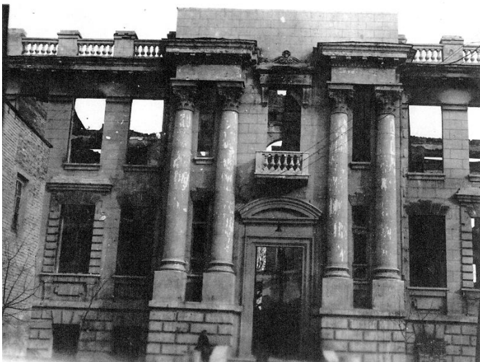
Школа № 24 (армянская) после бомбардировки. г. Краснодар, 1944 г.

В этом дискурсе школьных нарративов, нашел отражение фрейм «рабство» («иго»). В данном контексте метафора рабства при оккупантах противопоставлялась метафоре свободы при советской власти. Соответственно эсхатологическая тема наступления конца свободы при нацистах оттенялась апелляцией к тысячелетнему мифу о приходе царства добра и справедливости, в которое, очевидно, верили советские школьники (в анализируемых текстах это преимущественно девочки).