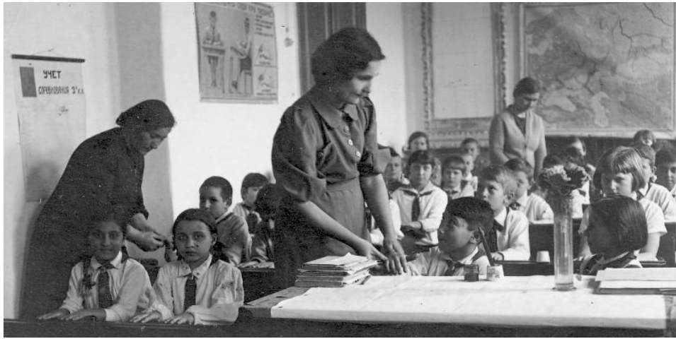
Учителя и учащиеся школы № 26. г. Краснодар. Начало 1940-х гг.

тированных позиций «очевидца» и «жертвы», что можно объяснить возрастными особенностями авторов нарративов.