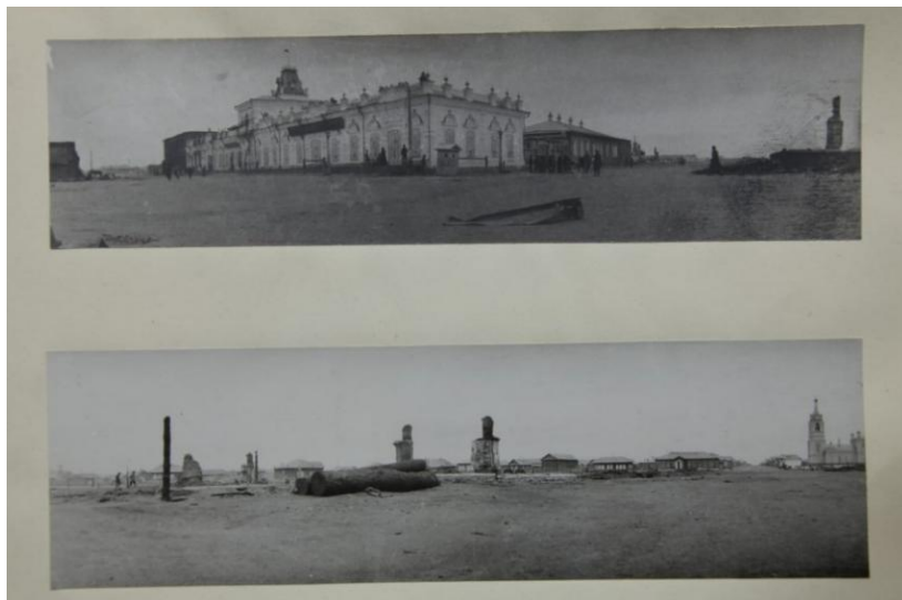
Рис. 2. Павлодар после пожара 24 мая 1901 года. Фотография Д. П. Багаева Источник: Болтина и др., 2018: 144.

«До конца мая 1901 года в Павлодаре насчитывалось более тысячи домов (почти все – деревянные), в том числе мечеть, несколько крупных магазинов (Дерова и др.), два склада земледельческих орудий и машин, почто-телеграфная контора, казначейство и шесть учебных заведений, расположенных по нескольким широким и правильным улицам. Однако уже в конце мая того же года две трети из них были уничтожены пожаром, и с тех пор большая часть города представляла собой огромную площадь, заваленную обгоревшими остатками домов и других строений» (Семенов-Тянь-Шанский, 1903: 386).