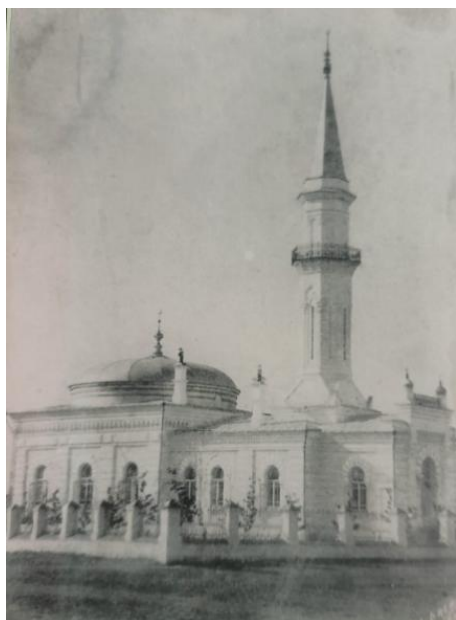
Рис. 3. Белая мечеть (Ак мешіт). Фотография Д. Багаева, 1912 год Источник: ПОИКМ. Оп. 1. Д. 2. Л. 12.

Сооружение отличалось монументальностью и лаконизмом архитектурных форм и стало одним из значимых религиозных и культурных центров Павлодара начала XX века.