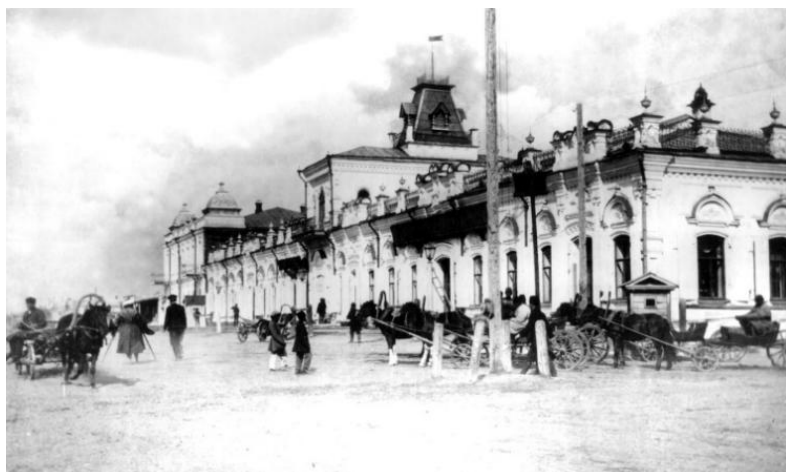
Рис. 1. Торговый дом А. Дерова. Ул. Телеграфная. Фотография Д. Багаева, 1912 год Источник: ПОИКМ. Оп. 1. Д. 2. Л. 10.

фасаду здания, примыкал дом Филатова, где размещалась почтово-телеграфная контора, а напротив находились бывшие Торговые ряды. Эти места были запечатлены фотографом Д.П. Багаевым (Рисунок 1).