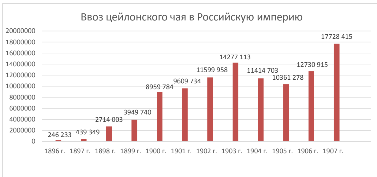
Рис. 4. Ввоз цейлонского чая в Российскую империю (в англ. фунтах) (РГИА. Ф. 32. Оп. 1. Д. 2404. Л. 5 об.)

На Рисунке 4 видно, что цейлонские чаи закупались в большом количестве (более чем 10 миллион ф.) начиная с 1902 г.