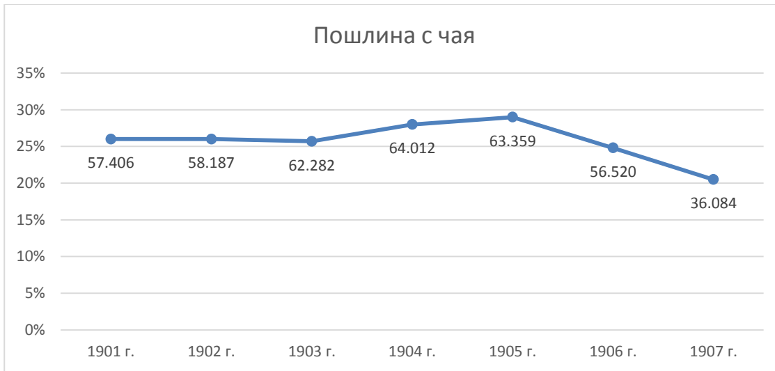
Рис. 2. Пошлина с чая по валовому таможенному доходу через Азиатскую (1901-1905 гг.) и Европейскую границы (1906-1907 г., январь – сентябрь) (РГИА. Ф.32. Оп. 1. Д. 2404. Л. 1)

Если не принимать во внимание 1904 и 1905 гг. как исключительные по своим условиям, то пошлина на чай давала ежегодно государству не менее 3/4 всех его таможенных доходов. Кроме того, из этой диаграммы видно, что абсолютная сумма пошлины с чая росла из года в год, за исключением 1905 г.