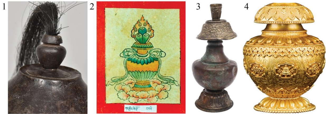
Рис. 6. Навершие шлема из НМРК (1) и ритуальные буддийские сосуды: 2 – изображение «Сосуда сокровищ» на тибетской танка XVIII–XIX вв.; 3 – ритуальный сосуд из собрания Центрального государственного музея Томской области, Монголия, XVIII–XIX вв.; 3 – фрагмент ритуального сосуда, Центральная Азия, XIX–XX вв.

Специальное исследование показало, что характерная форма сосуда придана навершию шлема далеко не случайно (Бобров и др., 2002: 233). Подобным образом в тибетском изобразительном искусстве традиционно обозначалась одна из разновидностей ритуальных буддийских сосудов (санскр. ghata , kalasha , тиб. bum pa ), известная как «Победоносный сосуд» 1 .