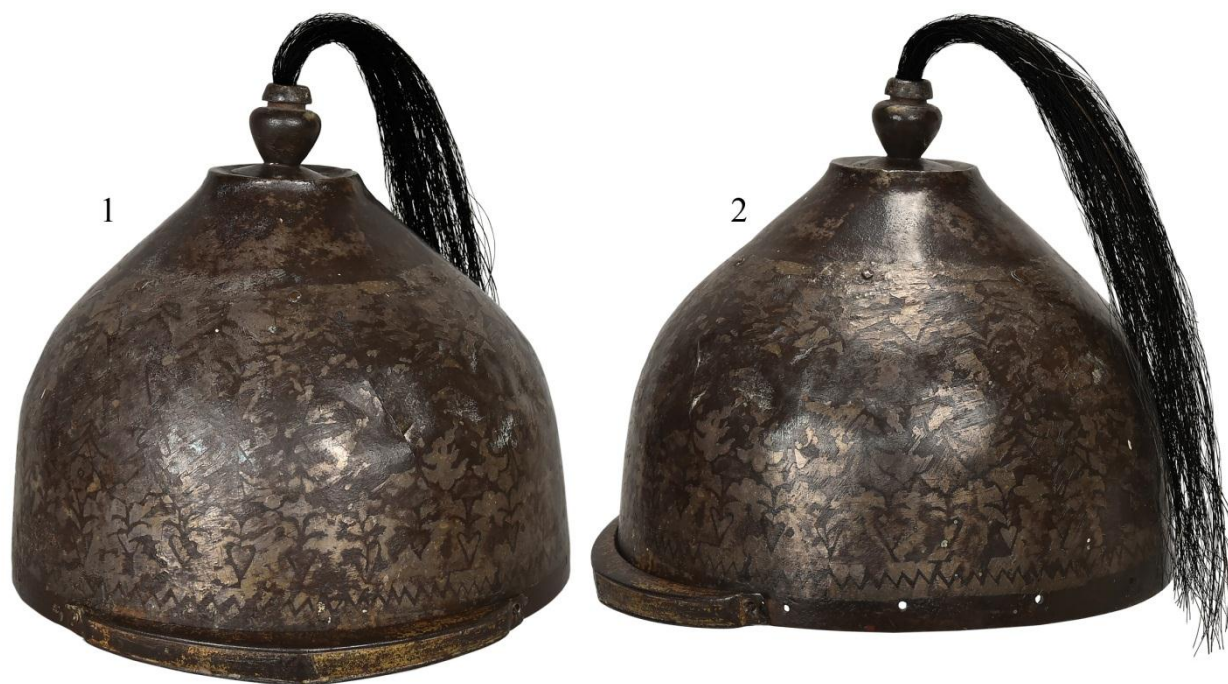
Рис. 2. Шлем из НМРК: 1 – вид спереди; 2 – вид слева.