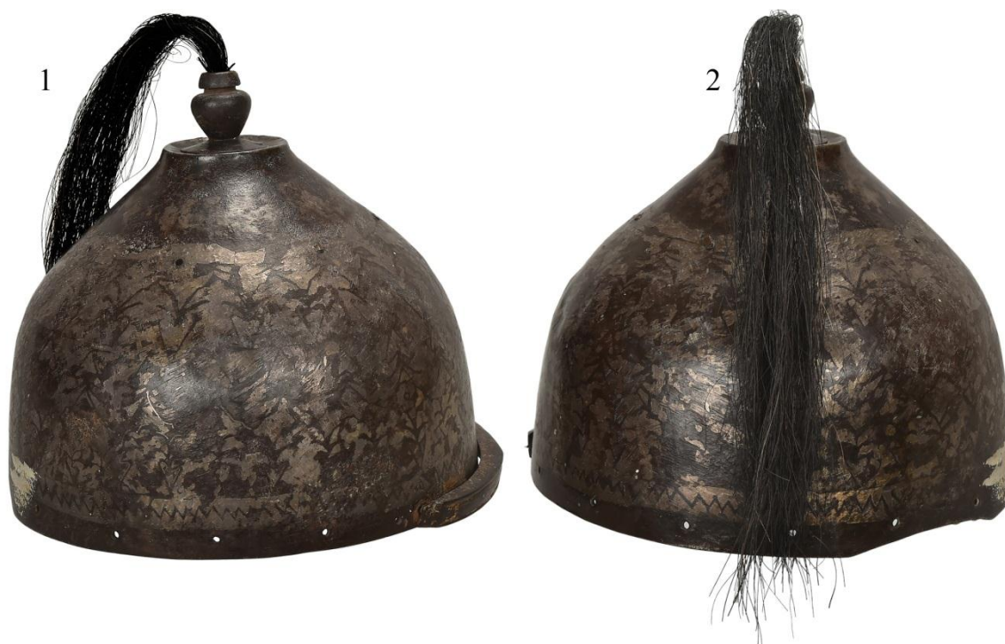
Рис. 3. Шлем из НМРК: 1 – вид справа; 2 – вид сзади