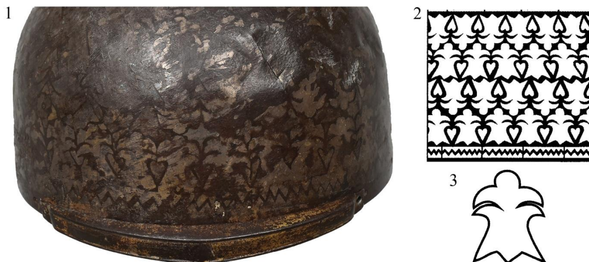
Рис. 4. Шлем из НМРК: 1 – фрагмент налобной части; 2 – прорисовка орнамента на тулье; 3 – деталь орнамента (2,3 – по: Ахметжан, 2015)

Стоит отметить, что серебряный орнамент покрывает не все пространство тульи, а только ее центральную часть. Вдоль нижней кромки шлема, где к наголовью крепились бармица, орнамент отсутствует. Нет его и на верхней части тульи (Рисунок 2; 3). Данный факт, а также наличие характерных отверстий и заклепок, расположенных по кругу в верхней части шлема (Рисунок 2; 3; 5), позволяют предположить, что первоначально коническая часть тульи была покрыта декоративной пластиной-накладкой, по каким-то причинам удаленной в ходе эксплуатации наголовья. Подобная накладка сохранилась на центральноазиатском шлеме аналогичной конструкции, хранящемся в собрании ВИМАИВиВС (Бобров, Анисимова, 2013: 202, рис. 10, 11; 203, рис. 12, 13; 204, рис. 14-16; 205, 206) 1 .