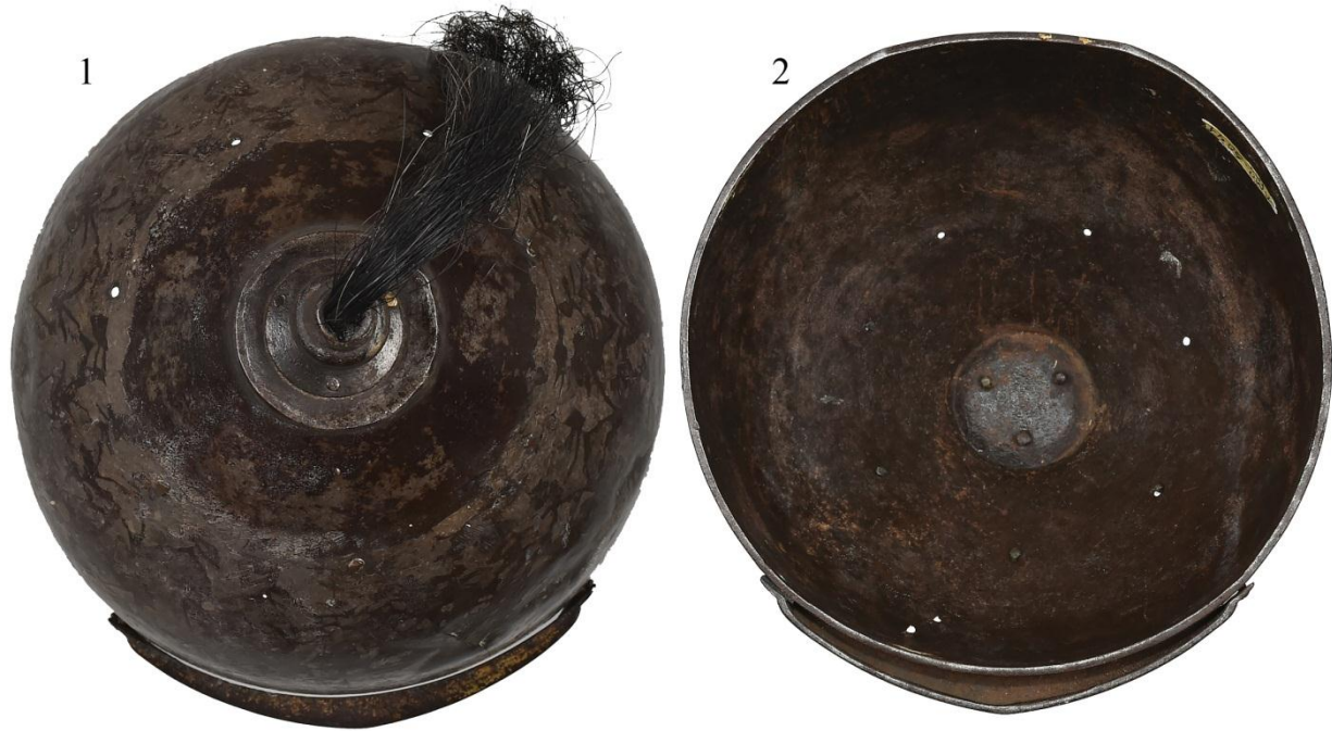
Рис. 5. Шлем из НМРК: 1 – вид сверху; 2 – вид снизу.