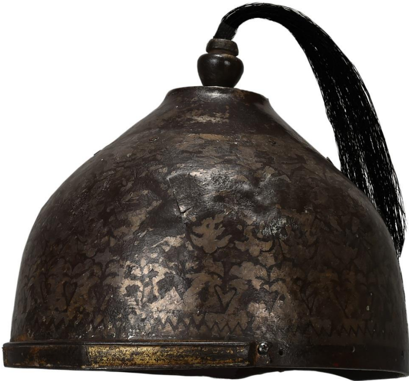
Рис. 1. Шлем КРҰМ нқ ҚЖ 114, НМРК, г. Астана, РК

В витрине «Батыры» Национального музея Республики Казахстан (НМРК, г. Астана) экспонируется стальной шлем (КРҰМ нқ ҚЖ 114). В силу особенностей своей конструкции и богатого декоративного оформления он представляет несомненный научный интерес для отечественных и иностранных оружейников, археологов и этнографов (Рисунок 1).