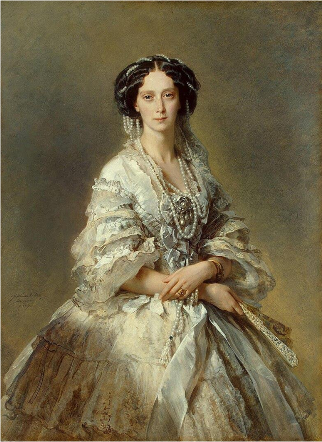
Рис. 1. Императрица Мария Александровна (1824–1880 гг.) (портрет работы Ф. Винтерхальтера, 1859 г.).

Личная жизнь императрицы исследована весьма полно. Вместе с тем мы хотели бы сделать акцент на ее достижениях в сфере создания системы государственной благотворительности, а достижения эти являются выдающимися. И в этой связи нельзя не упомянуть личностное влияние Марии Александровны на своего супруга Александра II. Как Екатерина Великая в свое время быстро осознала русскую сущность елизаветинской политики, так и Мария поняла приверженность супруга либеральным идеям. До конца жизни, даже когда личные отношения с Александром II дали «трещину», она оставалась его верным соратником и помощником и в деле либерального реформирования, и в сфере государственной благотворительности.