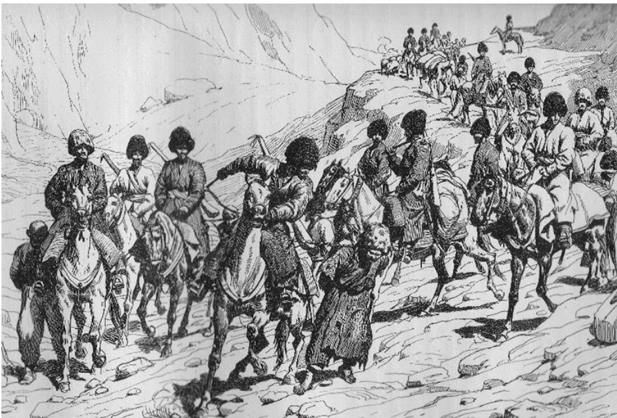
Рис. 3. Возвращение с аламана

Считая себя абсолютными хозяевами степей и пустынь, аламанчики не знали пределов своему хищничеству и жестокости. Ими угонялся скот, отбиралось имущество, уводились в плен мирные жители (см. Рисунок 3 ). Пленные мужчины, как наиболее «ходкий товар», после продажи на невольничьих рынках обращались в рабство, женщины либо брались аламанчиками в жены, либо делались наложницами (кырнах). Нераспроданных пленных аламанчики оставляли себе для «личного пользования» или отпускали, получив от родственников значительный выкуп. Один или два раба могли служить денежным эквивалентом при уплате за жену-туркменку (калым) ( Морозова, 1949: 68-70 ).