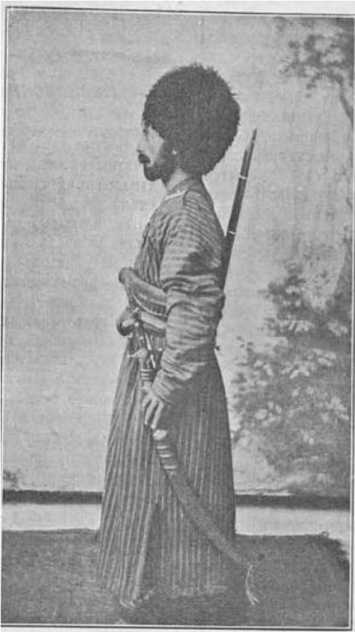
Рис. 2. Туркменский милиционер. Фотография из журнала «Разведчик». 11 июля 1900 г. № 508

дополнительные квазиполицейские силы, обеспечивая, таким образом, общественный порядок и спокойствие на периферии.