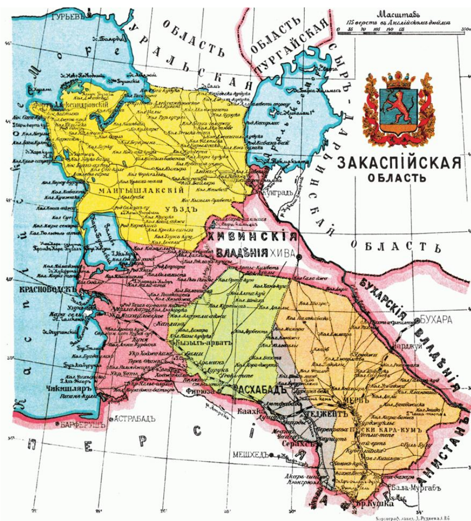
Рис. 1. Карта Закаспийской области Российской империи

Тридцать первого января 1890 г. был утвержден геральдический символ Закаспийской области – герб этой административно-территориальной единицы, находившейся в ведении Военного министерства Российской империи. Область простиралась между восточными берегами Каспийского моря, западными границами Хивинского ханства и Бухарского эмирата, граничила на севере с Уральской областью, на юге – с Афганистаном и Ираном. До октября 1920 года область делилась на пять уездов – Асхабадский, Тедженский, Красноводский, Мервский, Мангышлакский, которые, в свою очередь, делились на аульные общества. Некоторые уезды в силу неоднородной этнографической специфики делились еще и на приставства. Протяженность области составляла 501 698 кв. верст (535 430 кв. км), что значительно превышало по площади многие губернии центральной части дореволюционной России. В настоящее время территория бывшей Закаспийской области составляет большую часть независимого государства Туркменистан 1 .