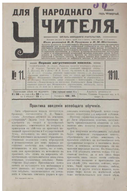
Рис. 2. Титульная страница журнала «Для народного учителя». 1910