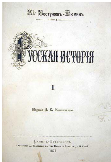
Рис. 2. Обложка книги «Русская история». Том 1.