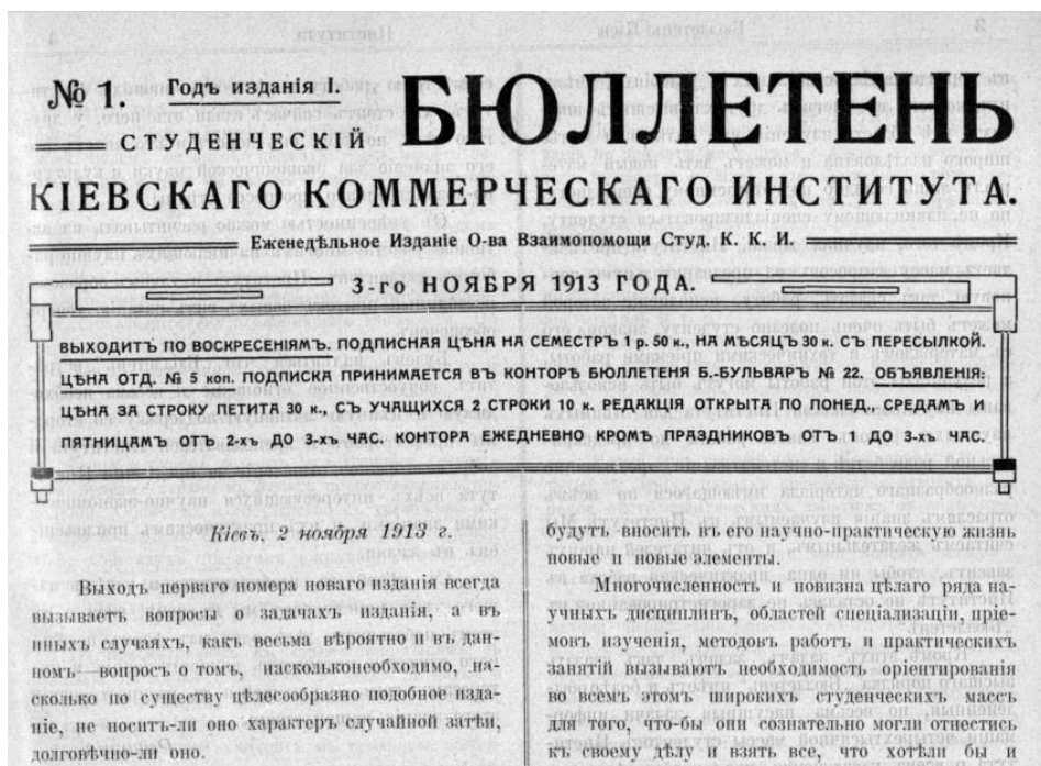
Рис. 2. Титульная страница издания «Студенческий бюллетень Киевского коммерческого института»