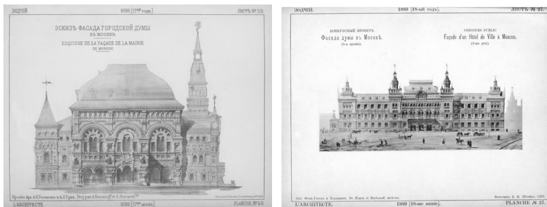
Рис. 1. Конкурсные проекты фасада городской думы в Москве. Журнал «Зодчий». 1888–1889. Листы 59, 27.