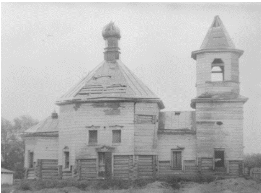
Рис. 5. Церковь Владимирская иконы Божией Матери, с. Нижнеманай. Фото 1990-х гг.

Сегодня церковь Владимирская сохранила свое градостроительное и общественное значение в формировании композиции и архитектурно-художественного облика села Нижнеманай. Статус церкви как объекта историко-культурного наследия подчеркивает ее значимость и диктует необходимость сохранения ее художественных и конструктивных характеристик.