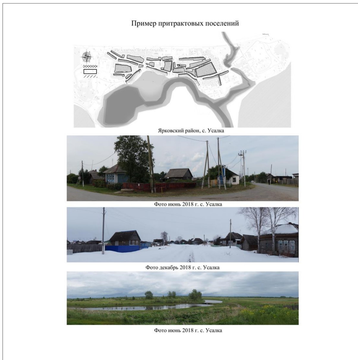
Рис. 4. Притрактковое поселение – с. Усалка, Ярковский район

В селе Нижнеманай близ Тюмени церковь была построена в 1866 г. на средства прихожан. В состав прихода входило 6 деревень (463 двора), прихожан насчитывалось 3300 человек, расстояние до уездного города 92 версты. В селе был построен дом церковного притча. Служащими храма являлись священник, дьякон и псаломщик. На средства прихожан в 1886 г. была организована церковно-приходская школа. В 1937 г. церковь была закрыта. В советское время в здании располагался дом культуры. Деревянный храм на каменном фундаменте, расположенный вдоль ул. Нижнеманайской при въезде в село, характеризуется традициями деревянного зодчества XVII в. с влиянием псевдорусского стиля.