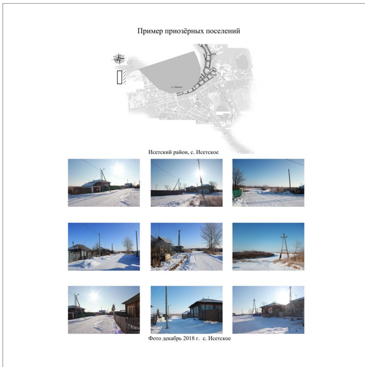
Рис. 3. Приозерное поселение – с. Исетское, Исетский район

Работа по выявлению и сохранению памятников деревянного зодчества в селах юга региона включает ряд действий, например, по созданию «музеев под открытым небом» (Гайдук, 2020) и привлечению внимания государственных структур к процессу сохранения уникальных объектов в южных селах Зауралья. Исследование памятников деревянного зодчества позволяет показать их потенциал в контексте социально-экономического развития поселений, определить способы их использования (в частности музеефикация), выявить общие тенденции формирования деревянной застройки, стилевые направления и необходимость реконструкции, реставрации и консервации памятников (Обследование..., 1990).