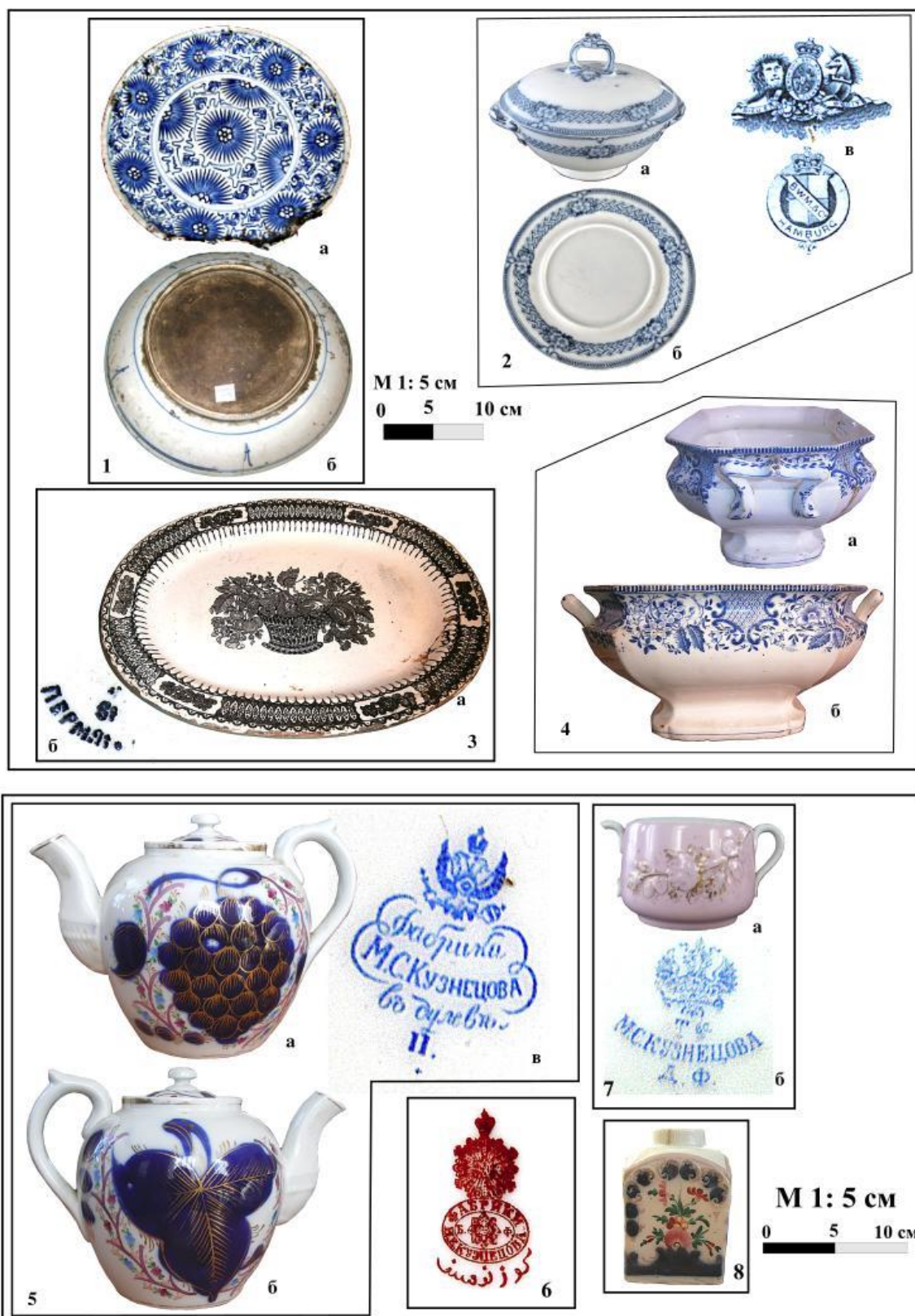
Рис. 1. Посуда из фаянса и фарфора сибирских бухарцев

1. Тарелка № 10: а – лицевая часть, б – оборотная часть. 2. Комплект № 23: а – миска с крышкой, б – тарелка, в – марка. 3. Блюдо № 12: а – лицевая часть, б – марка. 4. Суповая ваза № 16: а – профиль, б – фас. 5. Чайник № 20: а – вид спереди, б – вид сзади, в – марка. 6. Экспортная марка на чайнике № 22. 7. Сахарница № 27: а – вид спереди, б – марка. 8. Чайница № 21, вид спереди