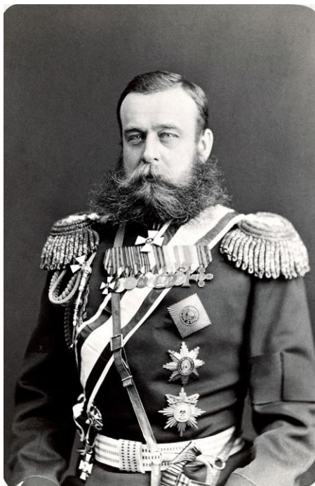
Рис. 1. Генерал Михаил Дмитриевич Скобелев

железной дороги. В это же время за подготовительными мероприятиями наблюдали текинцы. Они практически всегда пользовались моментом, если русские неосмотрительно отправляли слабо охраняемый обоз. Понимая это, русское командование предпринимало меры по достаточной защите своих обозов. Об эффективности такой работы свидетельствует тот факт, что в период с июня по ноябрь текинцы только дважды нападали на русские обозы ( Сборник сведений, 1901: 179 ). К 20 декабря 1880 г. в 12 км западнее от Геок-Тепе русские войска сосредоточили 38 армейских рот, 100 конных отрядов, 11 кавалерийских эскадронов при поддержке 72 орудий и 11 ракетных установок. Подразделения насчитывали около 5 тыс. штыков, 2 тыс. всадников при поддержке артиллерии. Текинцы, по разным сведениям, собрали от 25 до 40 тыс. защитников, на вооружении которых было около 5 тыс. винтовок и клинковое холодное оружие.