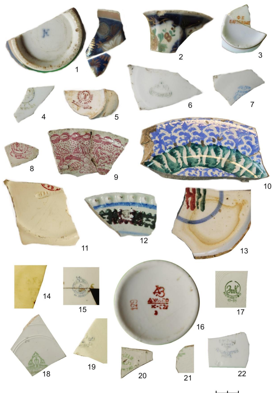
Рис. 3. Фрагменты российской фарфоровой и фаянсовой посуды. 1–13 – частных фарфоровых и фаянсовых предприятий Российской империи конца XIX – начала XX вв.; 14–22 – государственных фарфоровых заводов СССР XX в.

Кроме кузнецовского фарфора и фаянса, в Таре обнаружена продукция других фабрик, в частности завода братьев Чекановых. Он был основан в 1846 г. в Екатеринбурге на р. Исеть, первоначально производил гончарную продукцию, затем также фаянс. В 1864 г. на нем работало всего 2 мастера и 8 рабочих, однако они выпускали до 67500 шт. посуды на сумму 1325 руб., что означает высокий спрос на данную продукцию на Урале и в Сибири. В начале XX в. на заводе произошла механизация, вырабатывалась посуда на 12000 руб. в год (Серебренников, 1926: 18). В культурном слое Тары встречено большое количество фрагментов фаянсовой посуды, производимой на Чекановской фабрике, они хорошо идентифицируются по характерному узору и особенностям художественного оформления, найден также один фрагмент с клеймом (Рис. 3: 10–13).