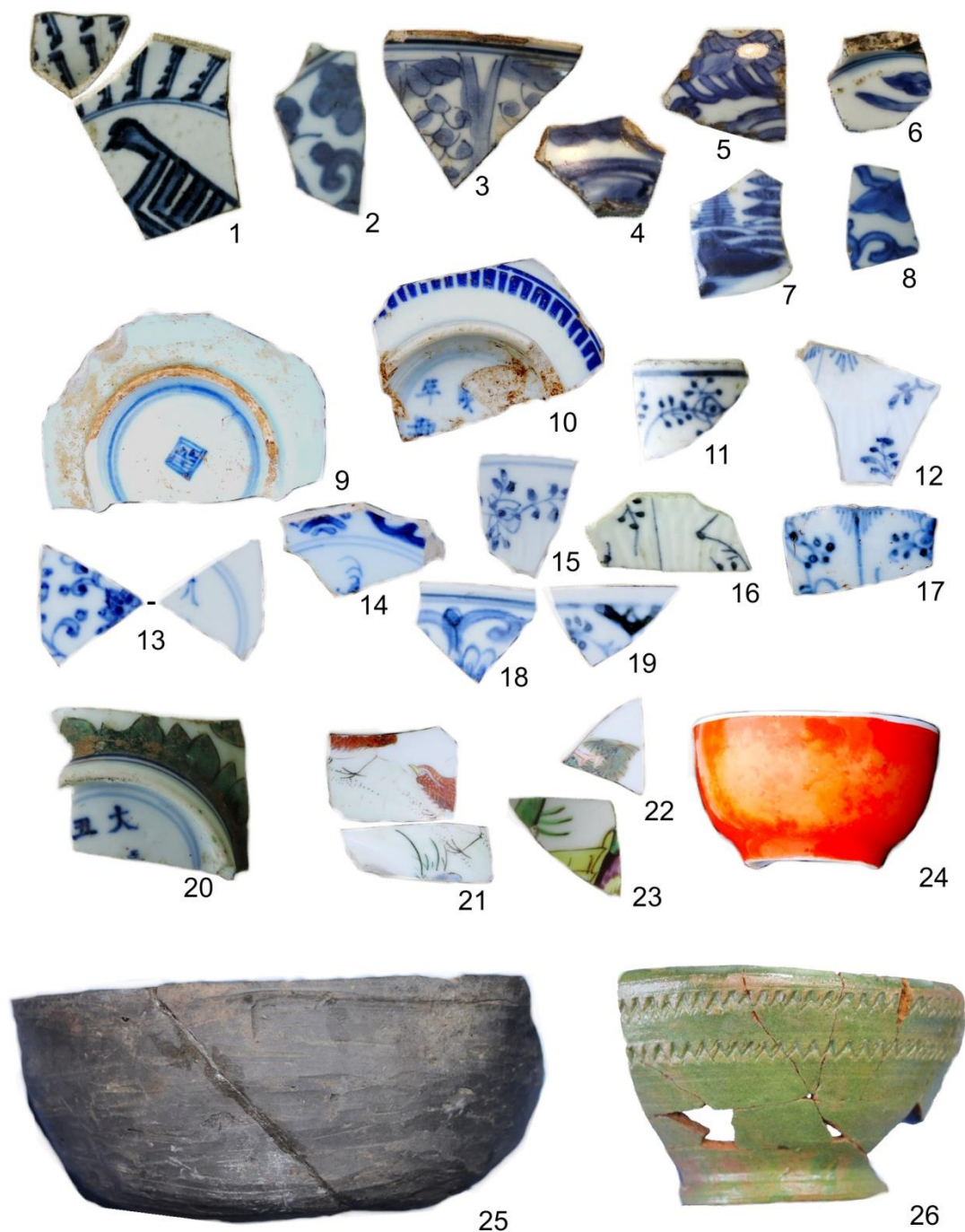
Рис. 1. Посуда XVII–XVIII вв. 1–8 – фрагменты китайского фарфора «переходного периода» (1620–1680); 9–19 – фрагменты китайского фарфора периода Канси (1662–1722); 20 – фрагмент китайского фарфора периода Юнчжэн (1723–1736); 21–24 – фрагменты китайского фарфора периода Цяньлун (1736–1796); 25–26 – фрагменты русской глиняной чайной посуды конца XVIII – начала XIX века

Больше всего находок китайского фарфора, сделанных при раскопках Тары, можно отнести к периоду правления императора Канси (1662–1722) (Рис. 1: 9–19). Цветовая гамма эмалей этого периода, кроме распространенных ранее синих и голубых цветов, начинает включать в себя зеленые тона разной насыщенности и оттенка, полученные на основе химических соединений меди (фарфор «зеленого семейства»). Для следующего периода Юнчжэн (1723–1736) (Рис. 1: 20) становится характерным появление розовых оттенков в цветовой гамме (Жущиховская, 2001: 40). В китайском фарфоре конца XVII – первой половины XVIII вв., обнаруженном в Таре, прослеживается общая для периодов Канси и Юнчжэн «живописная» линия росписи как в сюжетной основе, так и в технике; происходит дальнейшее усложнение комбинаторики орнамента (Кузьменко, 2009: 124).