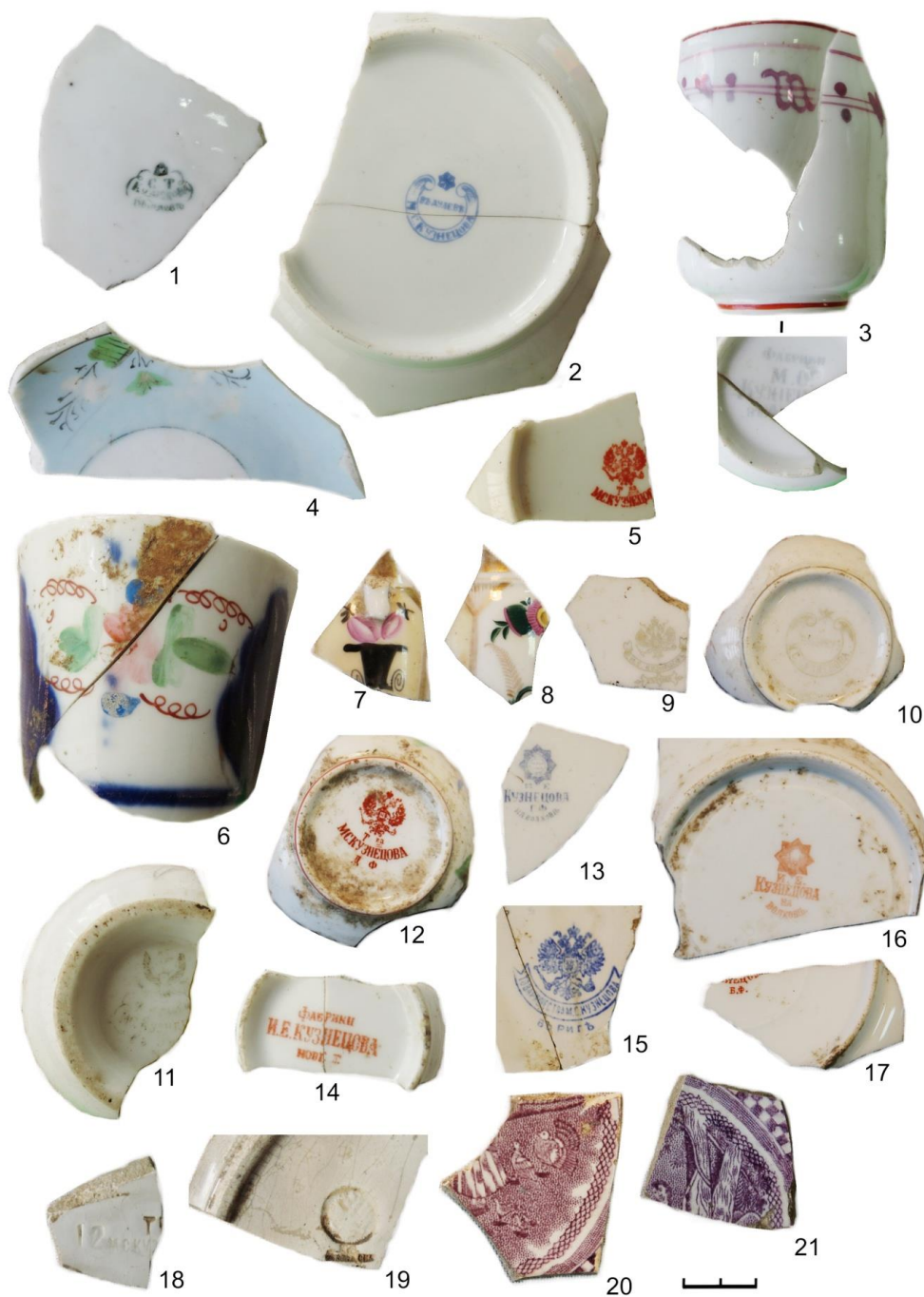
Рис. 2. Фрагменты российской фарфоровой и фаянсовой посуды Кузнецовских фабрик XIX – начала XX века

Заводы Кузнецовых были основным поставщиком фарфоровой посуды в Западную Сибирь в середине XIX – начале XX вв. Проследить характер распространения продукции можно не только по клеймам, но и по особенностям декоративного украшения посуды – этому способствовала стандартизация производства и его большой размах. Сопоставляя рисунки на фрагментах с клеймами, можно также определить время бытования того или иного орнамента.