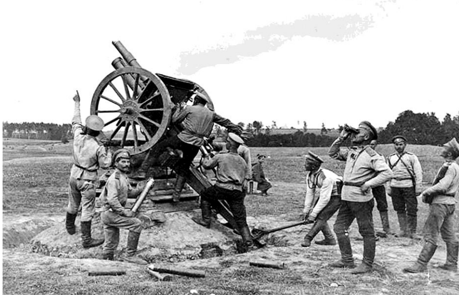
Рис. 2. Орудие, подготовленное для стрельбы по воздушным целям

шара артиллерийским огнем удавалось весьма редко. Если же осколки или шрапнельные пули и заставляли шар спуститься, то через полчаса вместо него поднимался другой шар, а поврежденный шар отправлялся в ремонт и спустя несколько часов мог вновь подниматься над позициями. Дальность действительного огня достигает примерно 5 км, а специальные орудия для стрельбы по шарам представляли собой большую редкость, к тому же офицер-воздухоплаватель быстро обнаруживает действующую артиллерию и тогда по телефонному сообщению по этим орудиям немедленно будет открыт заградительный огонь (Мильчевский, 1912: 119-120).