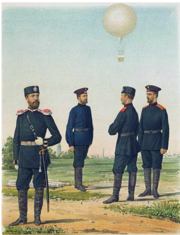
Рис. 3. Форма одежды личного состава русского воздухоплавательного парка в 1890-х гг. (Иллюстрированное описание, 1890: ил. 110)

Гибель угрожала также и тем воздухоплателям, которые поднимались слишком высоко над землей. Так, в 1875 г. во Франции трое ученых поднялись с научной целью на высоту 8 тыс. метров. Там они упали в обморок от нехватки кислорода, и при спуске на землю лишь один из них остался жив (Воздухоплавание, 1911: 58).