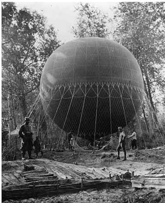
Рис. 1. Подготовка к запуску воздушного шара

США в 1861–1862 гг., причем американцы имели хорошо организованные воздухоплавательные отряды. Они не просто заявили о себе как о воздухоплателях, а первыми в мире начали фоторазведку. Так, в мае 1862 г. из армии унионистов, осаждавшей Ричмонд, был выпущен привязной шар и с него сделаны снимки окружающей местности как раз в то время, когда у неприятеля во всех родах войск шли приготовления к обороне. Этот снимок был отпечатан в двух экземплярах на бумаге с делениями; один из них был передан командующему армией, генералу Мак-Клейну, а другой – остался у офицера, поднимавшегося на шаре. Восемь дней спустя, накануне ожидавшегося решительного сражения, шар вновь был поднят на высоту в 350 метров. Сообщения о передвижениях неприятеля передавались офицером по квадратам сетки на снимке. Эти донесения дали командующему армией возможность отбрасывать неприятеля, своевременно выставляя резервы против него при каждой его попытке прорваться. Достигнутый успех доказал преимущества фотографических снимков местности перед изображением их на карте (Мильчевский, 1912: 116), что по сути заложило базу для формирования компетенций в области зондирования поверхности Земли.