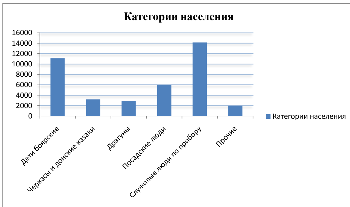
Диаграмма 1. Социальный состав служилого и посадского населения Юга России в 1640–1650-е гг.

Таким образом, имеющиеся у нас данные о количестве служилого и посадского населения на Юге России в 1640–1650-е годы можно представить в следующем виде (Диаграмма 1).