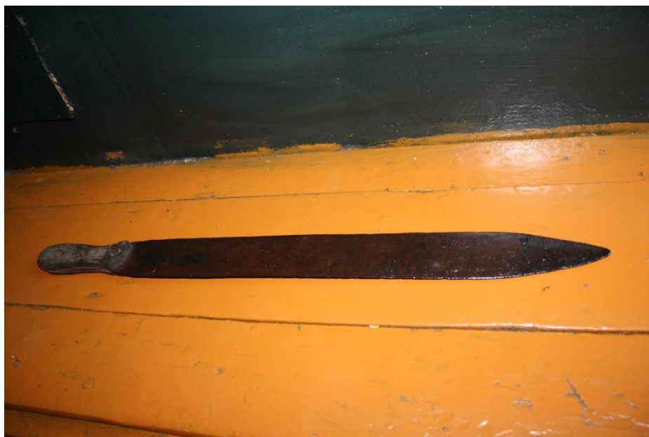
Рис. 1. Меч. Деревня Фарково Туруханского района