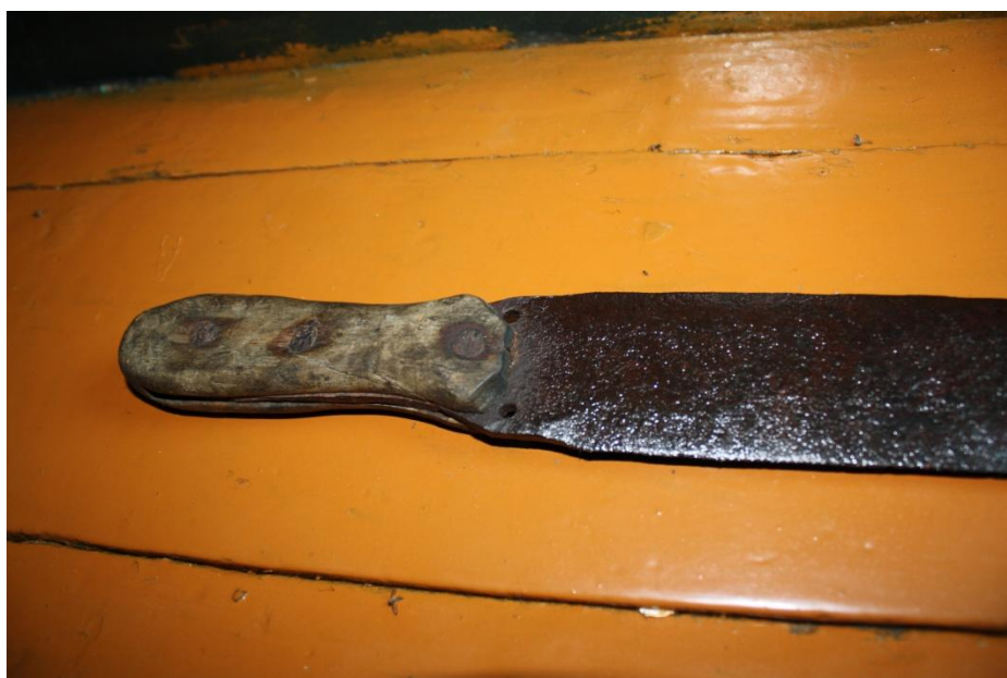
Рис. 2. Рукоятка меча. Деревня Фарково Туруханского района

У меня друг есть, он в Туруханске живет, а учился в Красноярске. И вот он мне привез ноутбук полностью по коренным малочисленным Севера. С интернета он списал. Там все это оружие, все есть. Все эти украшения. Все одежды. Это все у него есть. Откуда мог что узнать – это все есть там. У него хочу переписать на свой ноутбук. Этот меч я там видел. Там фотографии этих самых селькупов. Если я сейчас поступлю учиться, увезу его в Красноярск и спрошу, как они оценят его. А может, у них уже есть такой? А никто и не изучал. Я и хочу, если поступлю, дипломную работу буду делать по быту, по северу, по селькупам. Все это оружие, как они живут.