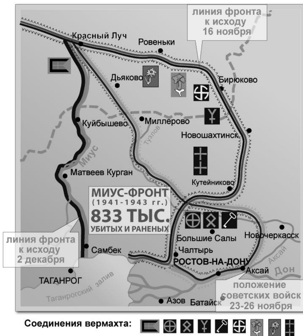
Рис. 2. Рождение Миус-фронта

Пополнив части личным составом, подвезя на передовую артиллерию, минометы и боеприпасы, советское командование стало готовить новый штурм Миус-фронта. С 10 по 15 декабря войска 56-й и 9-й армий предприняли вторую попытку ликвидировать таганрогский плацдарм противника. Но и в этот раз советские атаки были отражены с большими потерями. Только 31-я Сталинградская дивизия за эти дни потеряла более 3,3 тыс. чел. В отчетах и донесениях о результатах боев неизменно отмечалось: «Противник, опираясь на оборонительную систему окопов полного профиля и организованную систему огня артиллерии, кочующих минометов и пулеметов, продолжает сдерживать наступление наших войск» [28].