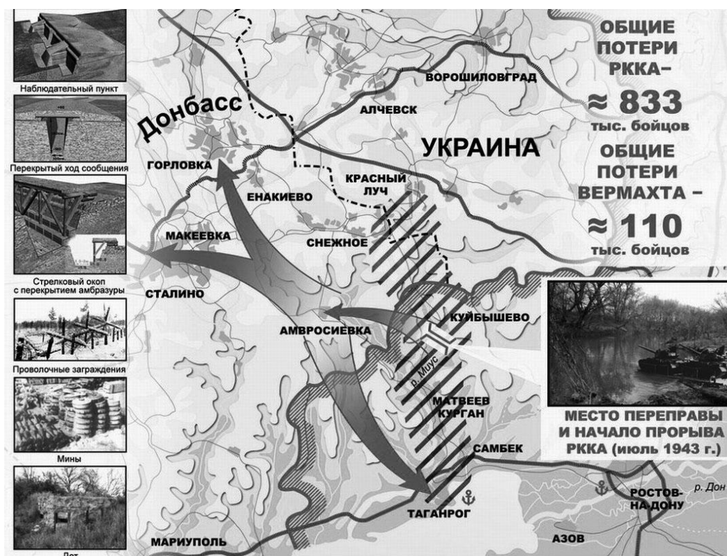
Рис. 4. Миус-фронт – зона кровопролитных боев в 1941–1943 гг.

Бесплодные попытки прорыва Миус-фронта Красная Армия продолжила весной 1942 г., но и они завершились неудачей, а летом началось новое немецкое наступление, в ходе которого противнику удалось выйти к Волге и Кавказскому хребту. В начале 1943 г. части и соединения РККА перешли в контрнаступление и освободили территорию Северного Кавказа. Однако дальнейшее наступление на запад вновь, как и в 1941 г., задержал Миус-фронт. Только в августе 1943 г. он был прорван, советские войска освободили Таганрог и Донбасс (см. рис. 4).