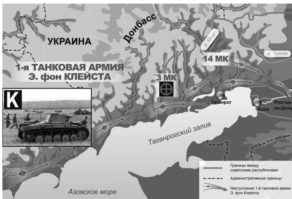
Рис. 1. Прорыв 1-й танковой армии Э. фон Клейста в Приазовье

Однако в конце сентября танковые и моторизованные войска Клейста прорвали советскую оборону (см. рис. 1). Главные силы 9-й и 18-й армий РККА (до 130 тыс. чел.) попали в окружение севернее Осипенко (Бердянска). При попытке прорыва погибли командующий 18-й армией генерал-лейтенант А.К. Смирнов, немало других командиров и красноармейцев. Непосредственный участник событий Манштейн вспоминал: «Мы захватили круглым счетом 65000 пленных, 125 танков и свыше 500 орудий» [10]. Прорывавшиеся из окружения войска 18-й армии стали отходить к Сталино (Донецку), а 9-й армии – к Таганрогу.