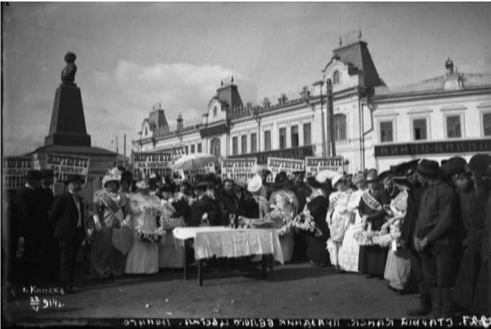
Рис. 1. Вонаго Л.Ю. Праздник белого цветка (мероприятие в помощь больным туберкулезом)

вольных и невольных», – военнопленных, размещенных на территории красноярского военного городка, и они пожертвовали 25 руб. (В военном городке, 1915: 3).