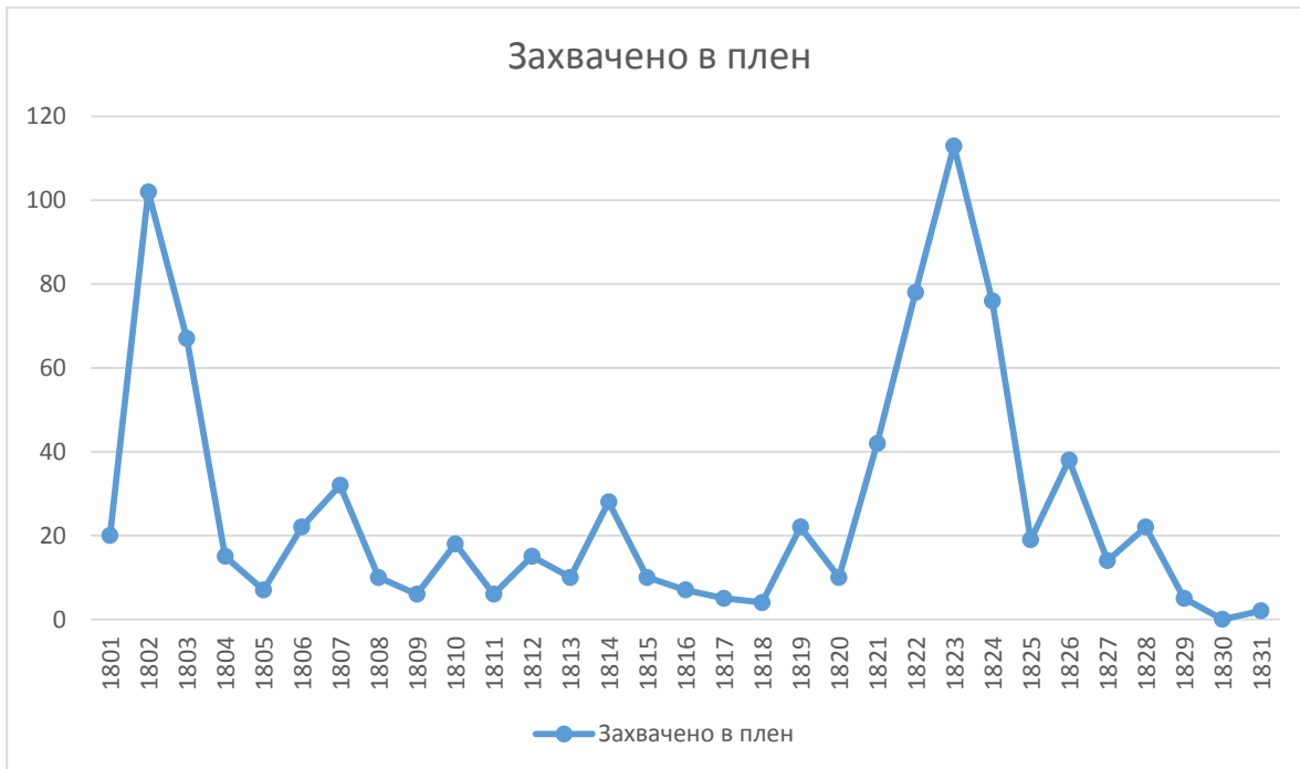
Рис. 1. Примерное число людей, захваченных на Оренбургской линии в 1801–1831 гг.