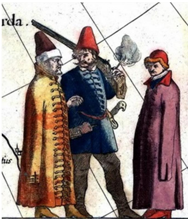
Рис. 2. Московский пехотинец с самопалом. Фрагмент карты Гесселя Герритса, составленной по чертежу царевича Федора Борисовича Годунова, 1613 г.

В начале XVII века в Путивль из Рыльска вели несколько дорог. Прямая – Большая Рыльская – проходила правым берегом Сейма и не имела значительных природных препятствий. Другая – вела к переправе через Сейм, и его левым берегом можно было добраться до Путивля, переправившись опять на правый берег на Дороголеводской переправе или непосредственно напротив города, но этот путь занимал больше времени и использовался в основном для обхода таможенных постов. Третья – это ответвление дороги между Рыльском и Новгород-Северским, проходившее через Крупец и далее на юг междуречьем Клевени и Эсмани. Эти дороги были хорошо известны, о чем свидетельствует начало возведения оборонительных сооружений, перекрывавших эти пути (Рисунок 1).