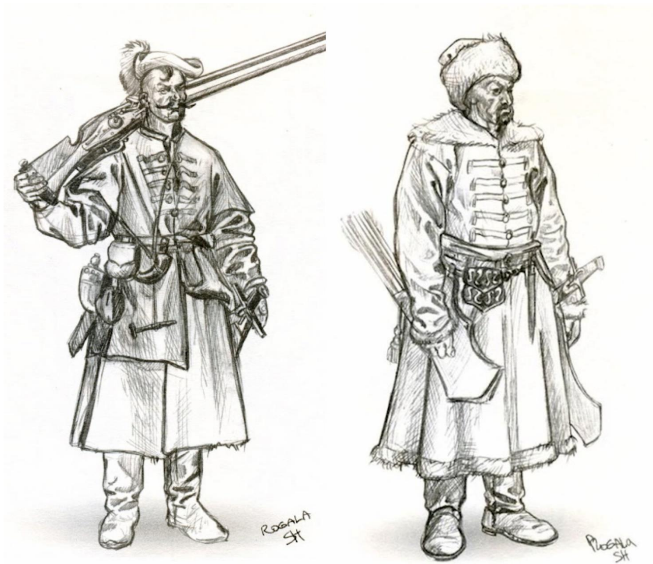
Рис. 4. Казацкая пехота начала XVII века. Рисунок и реконструкция С. Шаменкова

наличными силами о взятии Путивля или его осаде речи быть не могло. Теперь необходимо было отступить под прикрытие укреплений Рылъска, избежав нового сражения на уже невыгодных условиях.