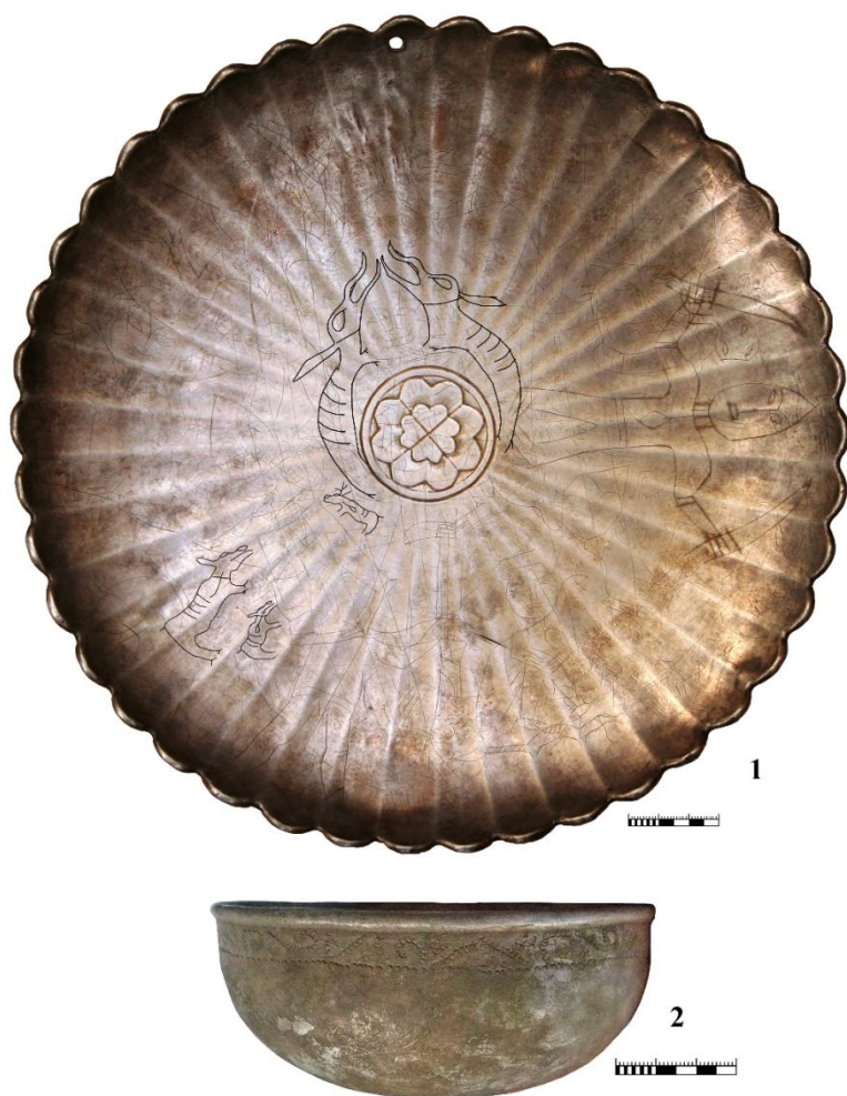
Рис. 2. Серебряная посуда из Сибири. 1 – византийское блюдо из района Горной Субботы (р. Иртыш); 2 – чаша из Хакасско-Минусинской котловины (?). 1, 2 – серебро

утолщение, чуть ниже, на внешней поверхности, идет поясok из растительного орнамента (близкий орнаменту большой чаши, но несколько упрощенный), подчеркнутый горизонтальным пояском. Штамп, которым наносился орнамент, также представляет собой окружность без центральной точки (около 2 мм диаметром).