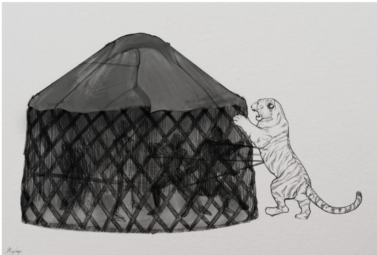
Рис. 2. Реконструкция способа охоты на тигров с использованием остова юрты (автор рисунка Жауһар Куранбек)

Тигры в XVIII–XIX вв. водились на Сырдарье, побережье Аральского моря, в низовьях Чу, в Южном Прибалхашье и Заилийском крае. Вдоль берегов реки Сырдарьи в густых зарослях камышей обитали тигры, которых казахи называли «патша жолбарыс», что в переводе означало «царь тигр». Путешественник Б. Залесский, участвовавший во второй половине XIX века в походах царской армии в Акмечеть (ныне г. Кызылорда), в своих записях отмечал: «В камышах Аральского моря и Сырдарьи обитает красивейший вид тигра – патша жолбарыс» (Залесский, 1991: 29). Местные жители этого края охотились на тигров в основном по двум причинам: во-первых, для защиты своего домашнего скота; во-вторых, для продажи шкур, так как торговля приносила большую прибыль.